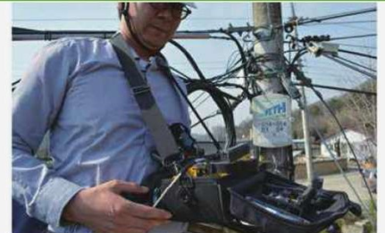
Conector Mecánico en Holder SOC